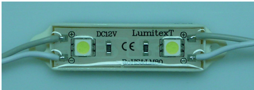
2-5050-SW57 LumiString LED module met 2 witte 5050 SMD LEDs met Epistar chips.